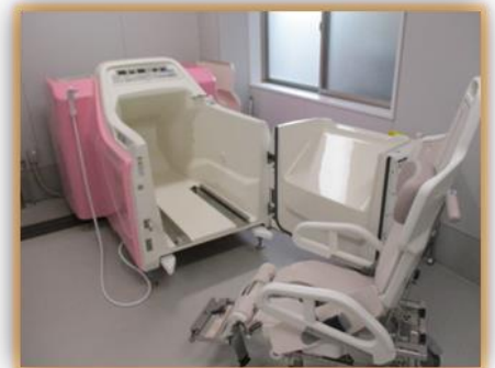
チェアインバス完備